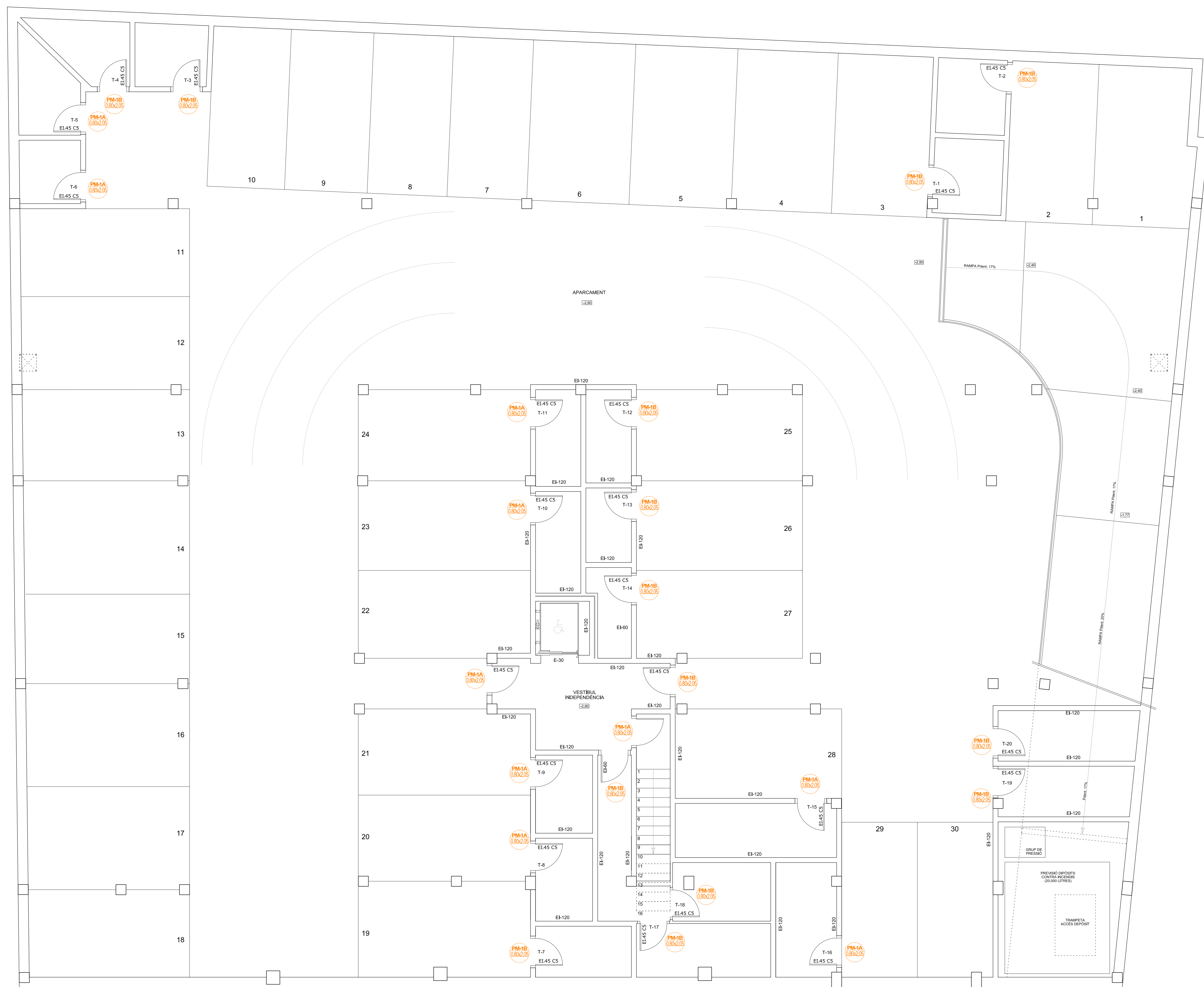
PLANTA SOTERRANI NIVELL -2,80 m Distribució i Mobiliari